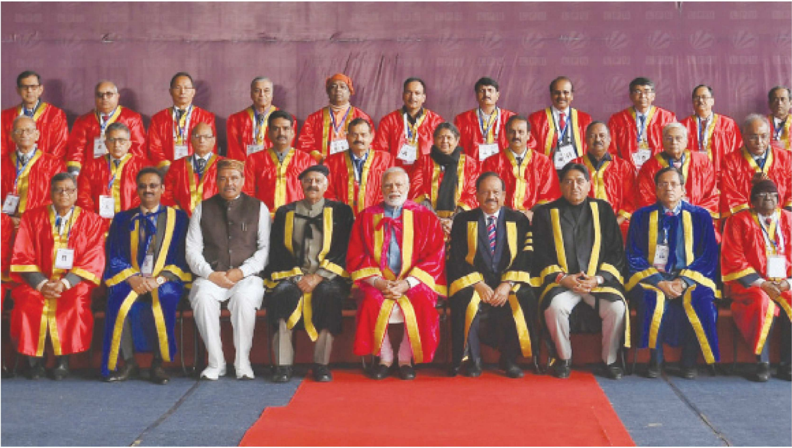
जालंधर, पंजाब में भारतीय विज्ञान कांग्रेस के 106 वें सत्र में एक समूह की तस्वीर में प्रधान मंत्री, श्री नरेंद्र मोदी। पंजाब के राज्यपाल और चंडीगढ़ के प्रशासक, श्री वी.पी. सिंह बदनोर, केंद्रीय विज्ञान और प्रौद्योगिकी, पृथ्वी विज्ञान और पर्यावरण, वन और जलवायु परिवर्तन मंत्री, डॉ. हर्षवर्धन और सामाजिक न्याय और अधिकारिता राज्य मंत्री, श्री विजय सांपला को भी देखा जाता है।