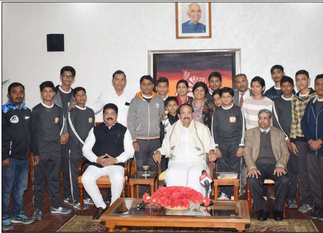
The Vice President, Shri M. Venkaiah Naidu with a group of Students from Bohra Central School, Parola, Jalgaon, Maharashtra, who called on him, in New Delhi.